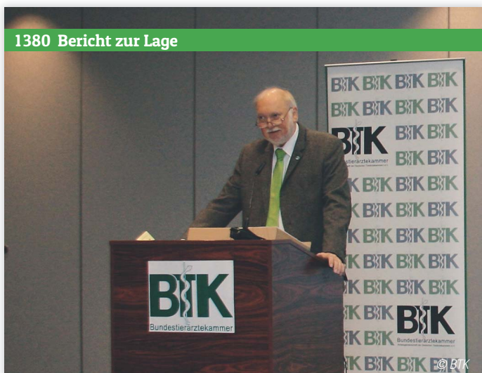
1380 Bericht zur Lage