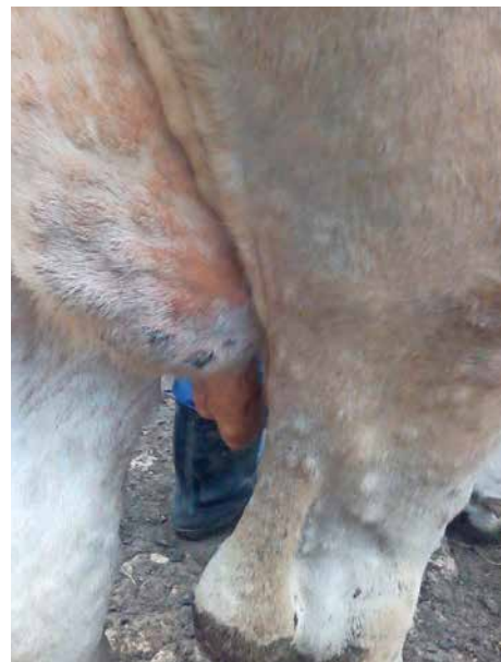
Abb. 4 und 5: Euter und Zitzen sind regelmäßig von den nodulären Hautveränderungen betroffen.

Die Übertragung des LSD-Virus erfolgt in erster Linie durch blutsaugende Insekten, wobei es sich