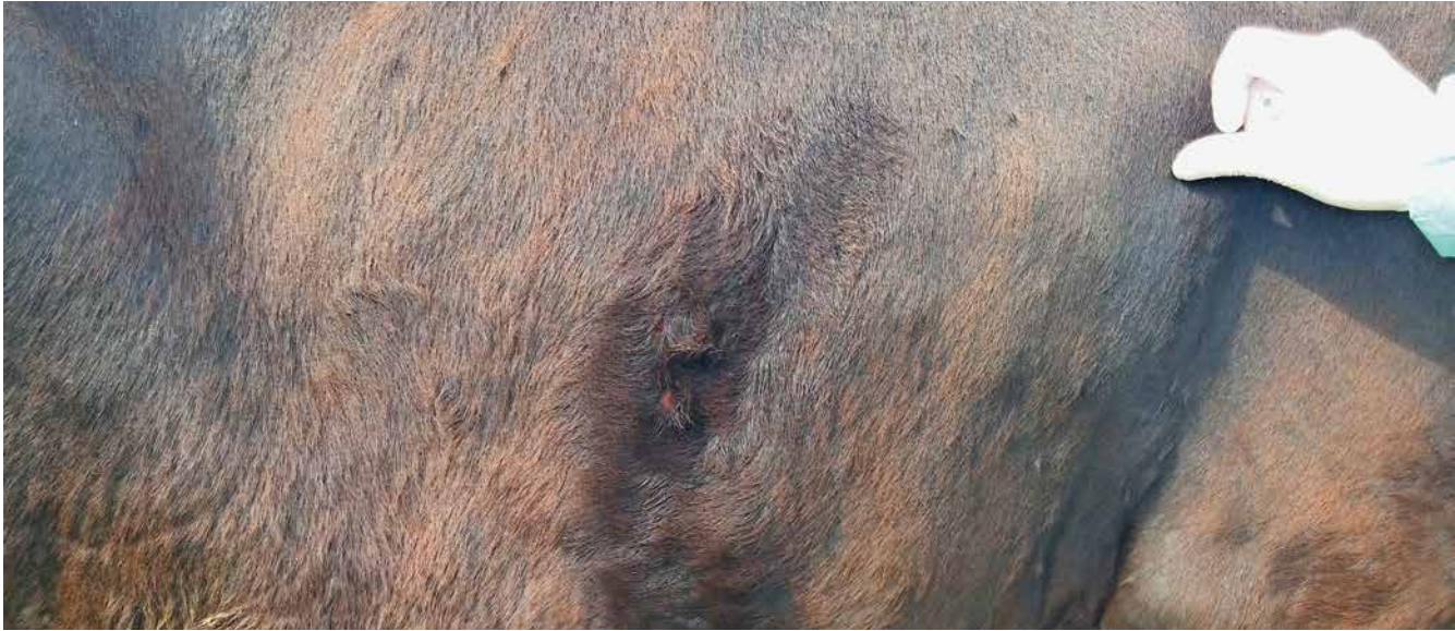
Abb. 3: Die nodulären Läsionen sind z. T. nur durch Ertasten feststellbar.

teilweise nur durch Ertasten feststellbar (Abb. 3). Regelmäßig sind auch das Euter und die Zitzen von Hautveränderungen betroffen (Abb. 4 und 5).