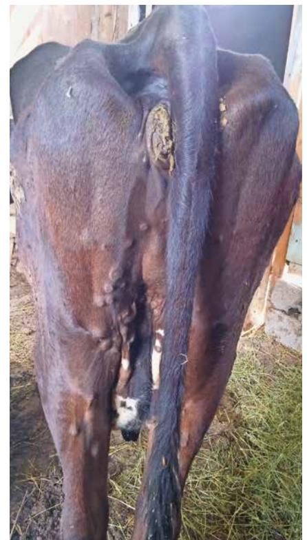
Abb. 2: Typische Hautveränderung LSD-erkrankter Tiere im Bereich des Perineums.

Klinisch erkrankte Tiere zeigen Fieber und später typische Hautveränderungen v. a. im Bereich von Perineum und Skrotum ( Abb. 2 ). Diese knötchenartigen (nodulären) Läsionen können auch sehr dezent ausfallen und sind