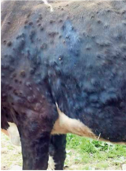
Abb. 6: Ein generalisiertes Auftreten der nodulären Hautveränderung ist bei weniger als 30 Prozent der infizierten Rinder zu beobachten.

nach Land wird die komplette Tötung der betroffenen Herden oder auch ein modifiziertes „stamping-out“ (Tötung klinisch betroffener