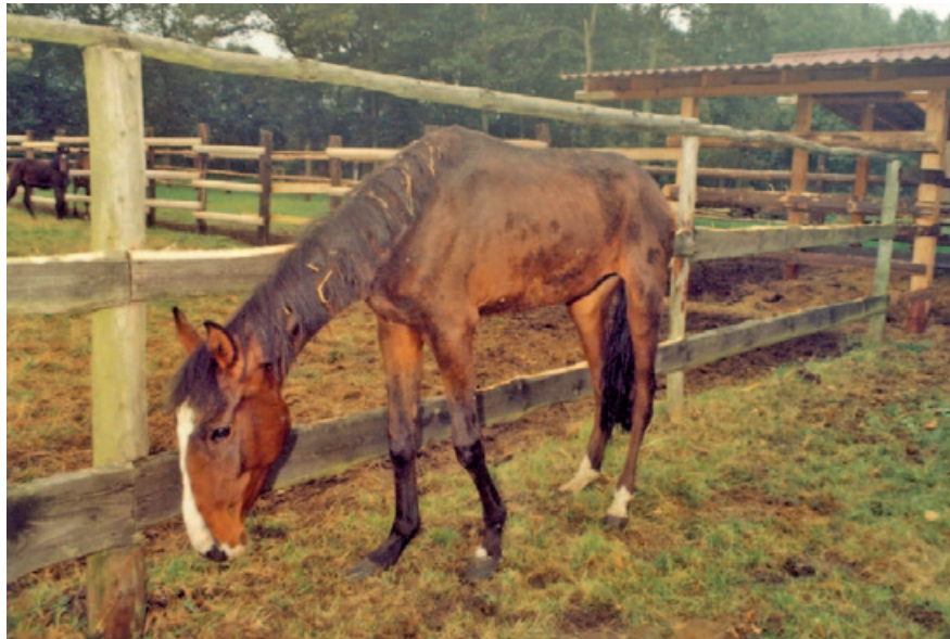
Trifft man während seiner Berufsausübung auf tierschutzwidrige Verhältnisse, kann dies trotz vorhandener Schweigepflicht eine Anzeige rechtfertigen.

Noch immer besteht Unsicherheit über die Grenzen der tierärztlichen Schweigepflicht. Wann darf oder muss der Tierarzt einen Tierschutzverstoß dem Veterinäramt melden? Wann darf er bei der Polizei oder Staatsanwaltschaft Anzeige erstatten? Im Folgenden wird versucht, den aktuellen Stand der Diskussion zusammenzufassen und Entscheidungshilfen zu geben.