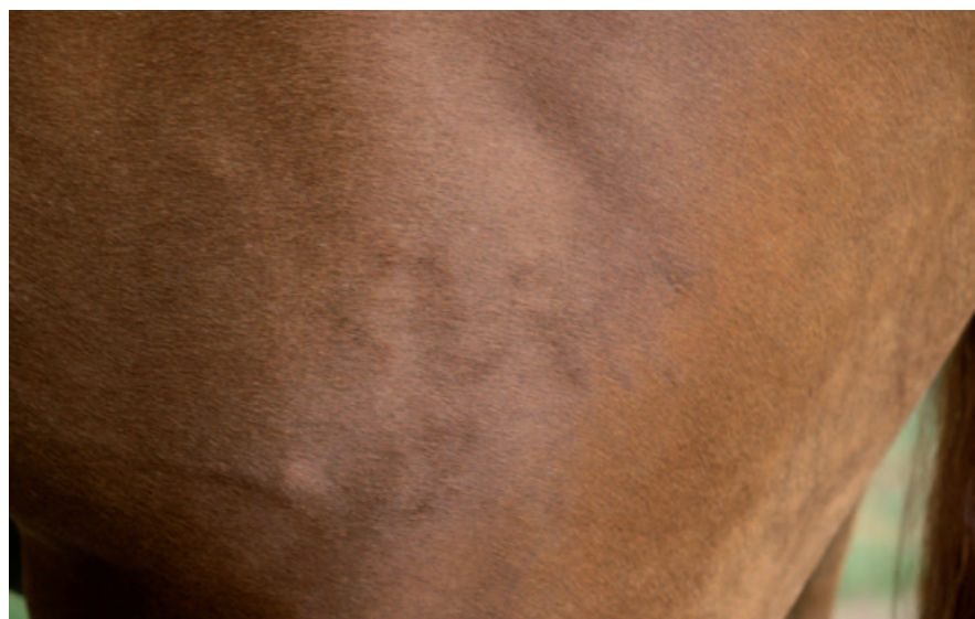
Abb. 4: Unleserliches Brandzeichen Verbandszeichen: Deutsches Sportpferd; Nummernbrand nicht identifizierbar (soll lauten: 74)

Bei 428 Pferden in 24 Betrieben wurde mit drei Lesegeräten (A: Minimax II; B: i-Max plus; C: Isomax V; Virbac, Bad Oldesloe) die Ablesbarkeit eines Mikrochips überprüft und die abgele-