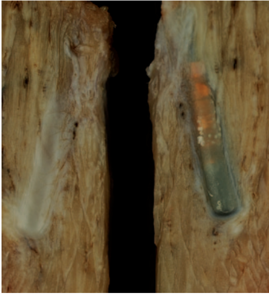
Abb. 2: 11 Monate altes Warmblutpferd mit intramuskulärem Transponder umgeben von dünner, grauer Gewebekapsel