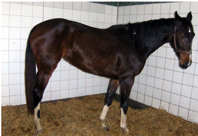
Pferd mit EIA.